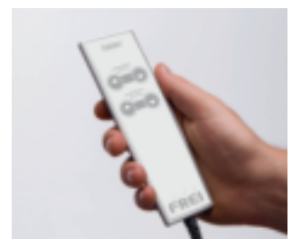
Handschalter für TAXXO® flex mit Magnetbefestigung zur bequemen Höhenverstellung serienmäßig.