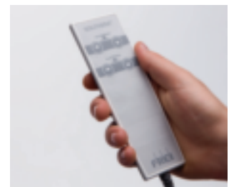
Handschalter für Solithera® mit Magnetbefestigung zur bequemen Höhenverstellung serienmäßig.