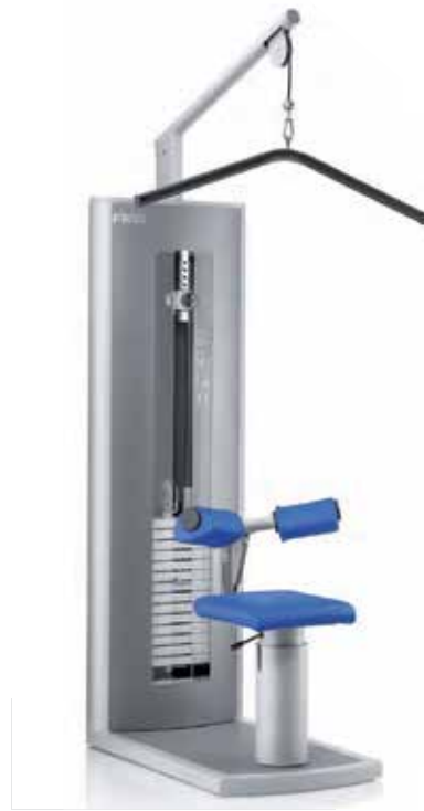
Alle Geräteabbildungen entsprechen nicht der Optik mit FREI GUIDE System.