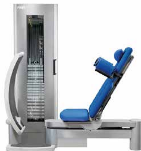
Alle Geräteabbildungen entsprechen nicht der Optik mit FREI GUIDE System.