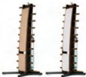
Abb. zeigt: Modelle Walnuss