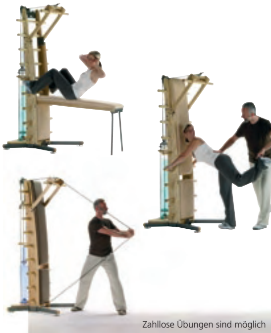
Zahllose Übungen sind möglich